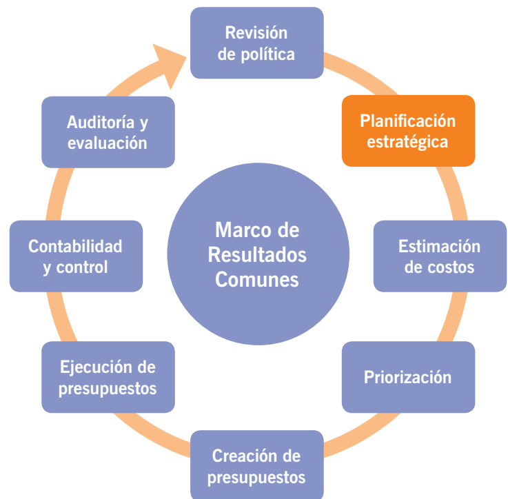
Figura 1: Desarrollo de un Marco de Resultados Comunes

Esta nota se centra en los requisitos básicos para conseguir una planificación multisectorial eficaz a través de unos resultados de nutrición comunes, tal y como se destaca en rojo en el diagrama. El proceso conlleva determinar rutas comunes para estrategias sectoriales y alinear planes sectoriales para conseguir objetivos en materia de nutrición. Esta nota sirve como referencia para los países que participen en el desarrollo de planes multisectoriales. No se trata de un modelo de seguimiento obligatorio, sino más bien destaca los aspectos fundamentales que se deben considerar a la hora de empezar el proceso basándose en la experiencia de Maximising the Quality of Scaling Up Nutrition (MQSUN). Cabe destacar que la terminología puede variar entre países. Cada país puede seguir un método distinto y debería basarse en sus fortalezas y los sistemas ya implantados.