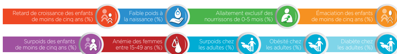
Figure 1: Cibles mondiales de la nutrition et cibles de maladies non transmissibles liées à l'alimentation pour 2025

La version préliminaire de l'aide-mémoire a été élaborée par un groupe de travail composé d'experts en politiques et en gestion du cycle budgétaire, sous la coordination du Réseau des Nations Unies pour SUN et du Secrétariat du Mouvement SUN entre mai et août 2016. Cette version préliminaire sera disséminée dans les pays SUN, en particulier ceux qui entreprennent de nouveaux cycles de planification, afin de recueillir des contributions supplémentaires des parties prenantes des pays. La participation des pays sera coordonnée par le Réseau des Nations Unies pour SUN et le Secrétariat du Mouvement SUN, qui fourniront des commentaires directs et assureront la liaison avec les experts, au besoin. Les pays auront la possibilité de participer et de faire des contributions supplémentaires à la liste de vérification entre janvier et juin 2017. Après juin 2017, une version définitive de la liste (et des documents de référence connexes) sera disponible au public sur le site Web du Mouvement SUN ( www.scalingupnutrition.org ). Une deuxième circulation de la liste tirant les enseignements de son utilisation est prévue pour la fin de 2018.